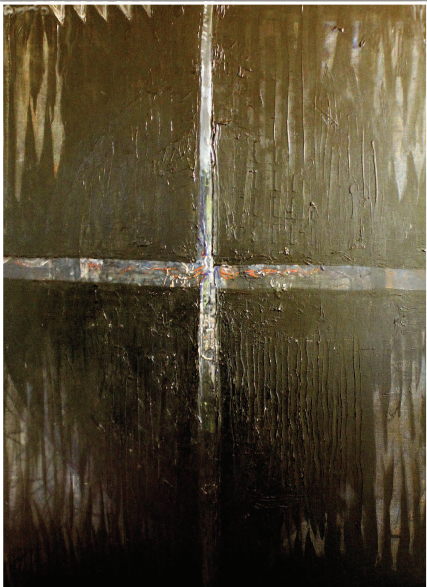
CROCE (akril, vászon) 100 x 70 cm, 2012.