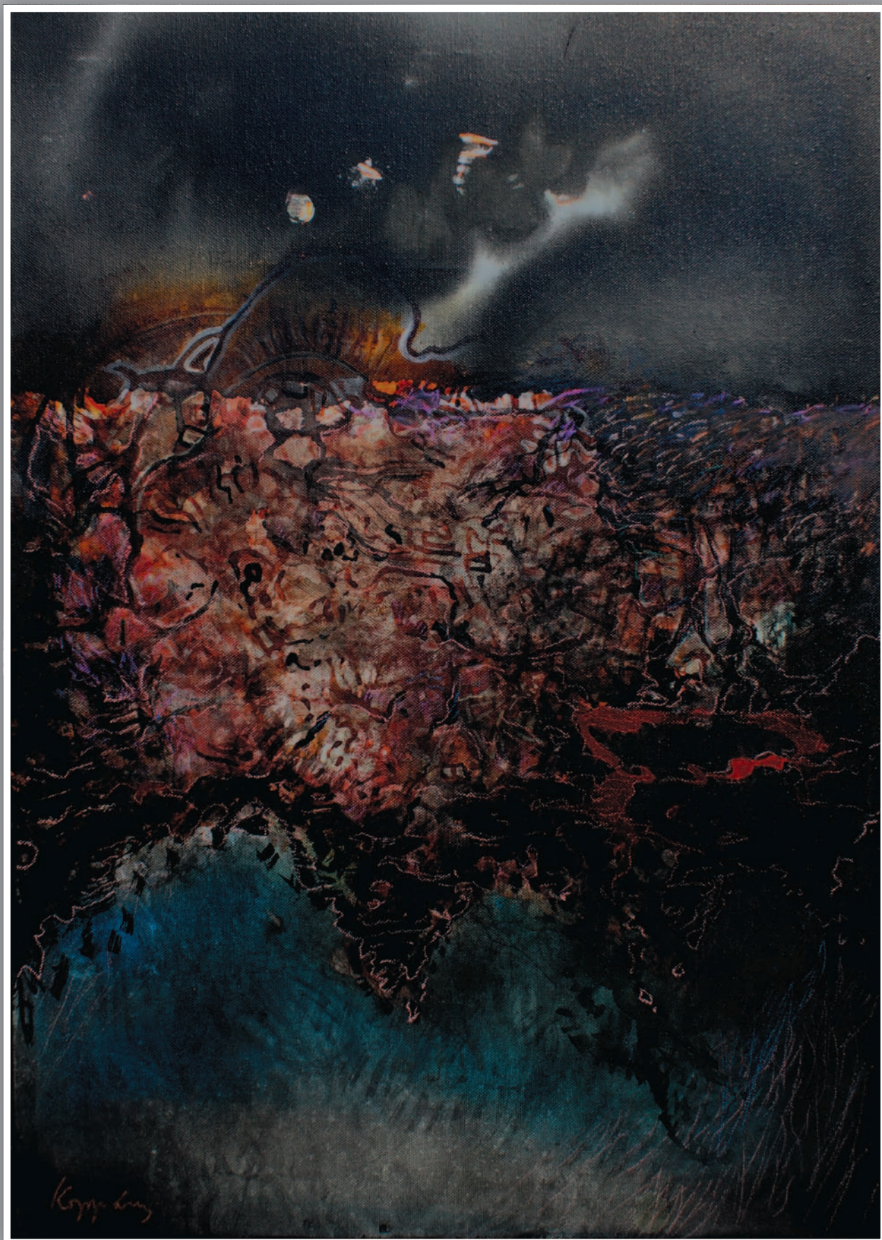
FÖLDI TÁJ (akril, vászon) 70 x 50 cm, 2014.