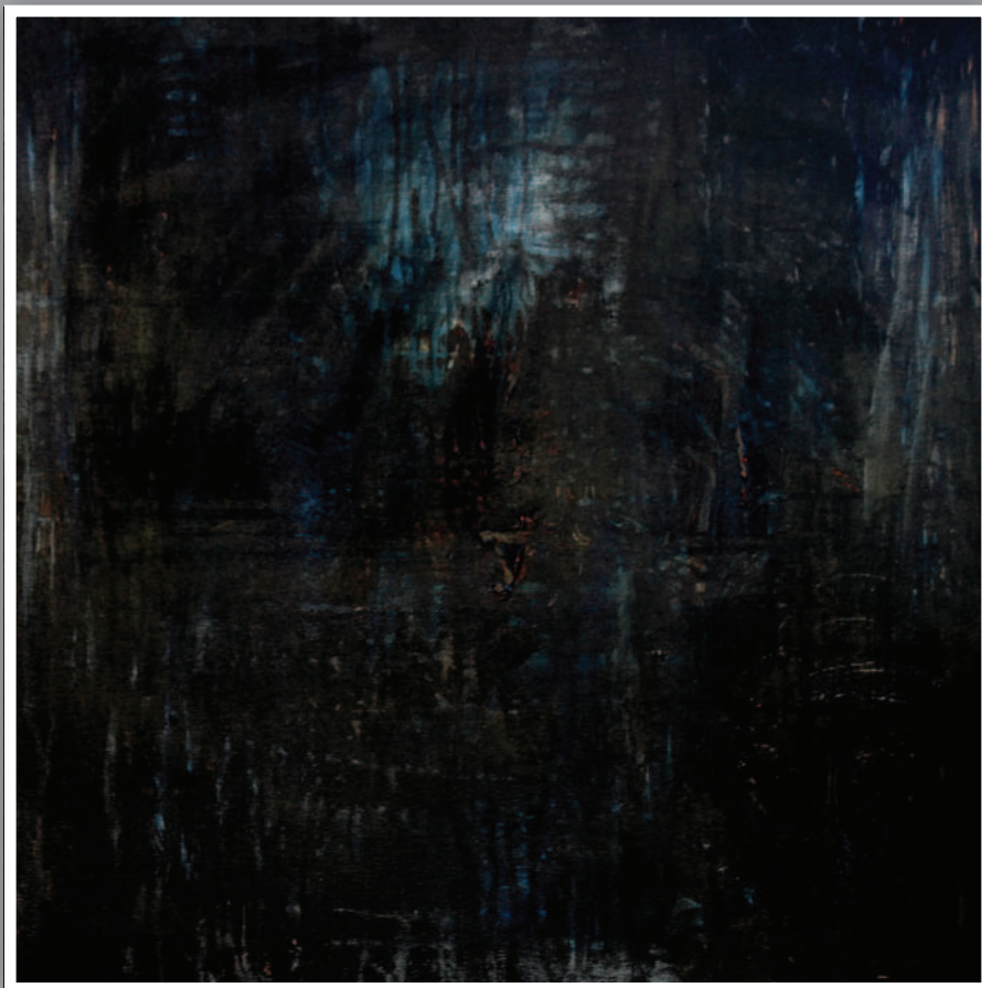
EXIT (akril, vászon) 70 x 70 cm, 2010.