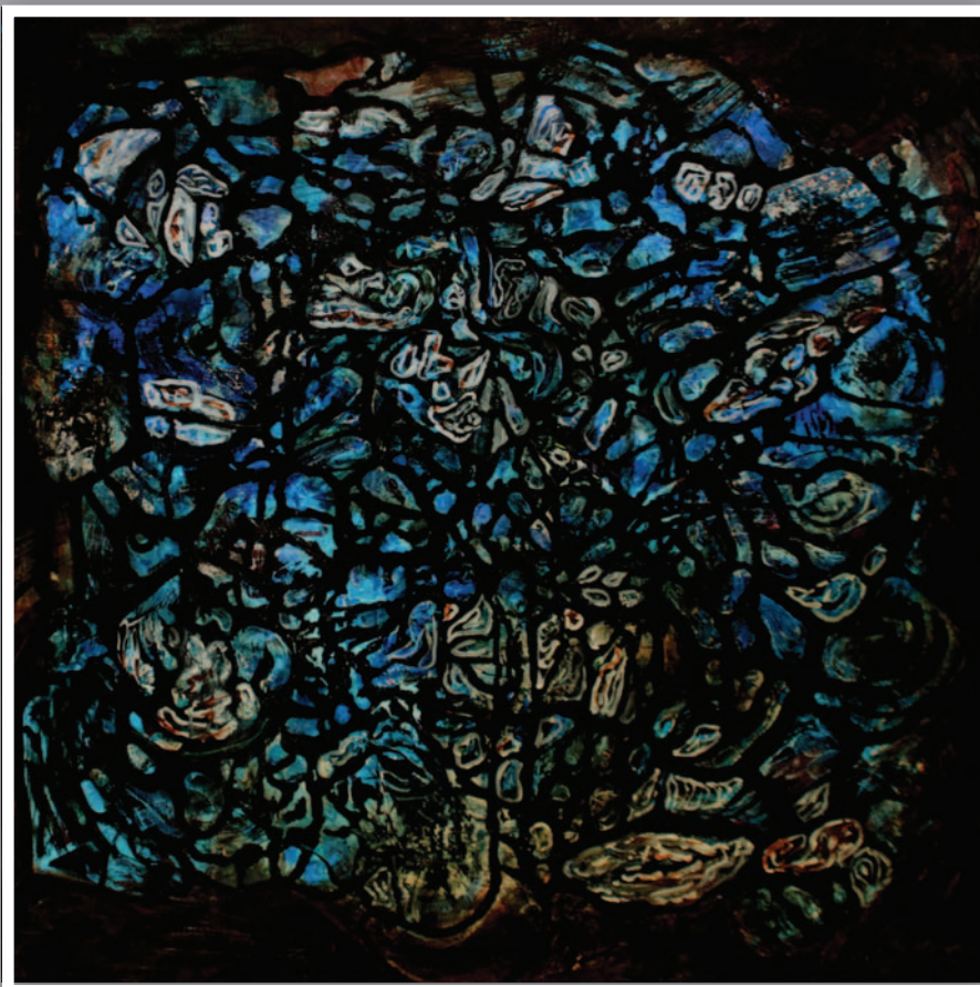
LABIRINTUS (akril, vászon) 70 x 70 cm, 2014.