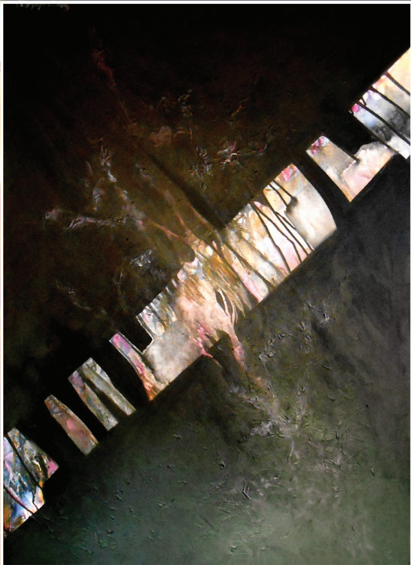
REMÉNY (akril, vászon) 100 x 70 cm, 2012.