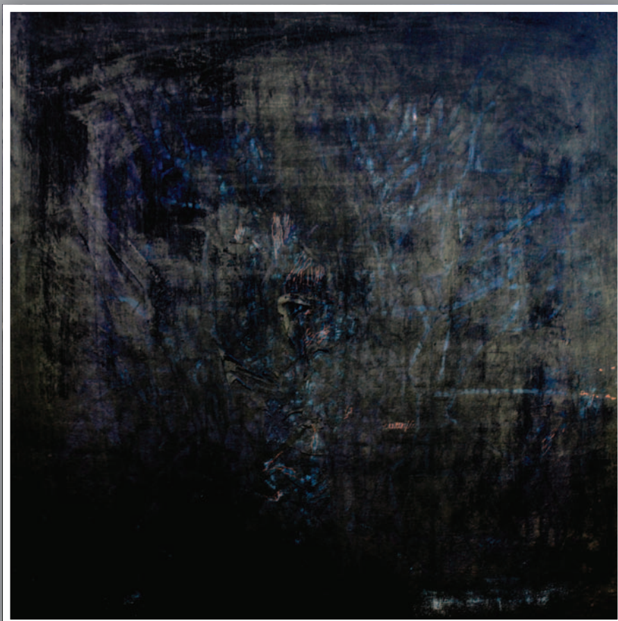
GYÁSZ (akril, vászon) 70 x 70 cm, 2010.